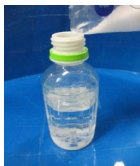
①しおとみずをまぜて しおみずをつくる