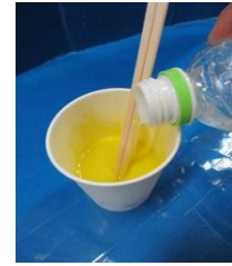
③①にしおみずを いれる