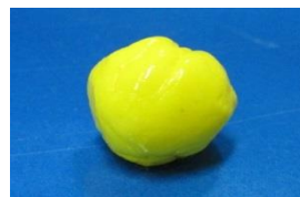
⑥すこしかわかったら かんせい!