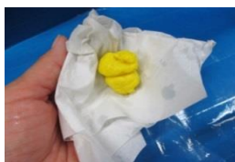
⑤わりばしについた かたまりをティッシュで ふきながらまとめる