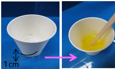
②せんたくのりにすきなえのぐを すこしいれて、わりばして まぜているをつける