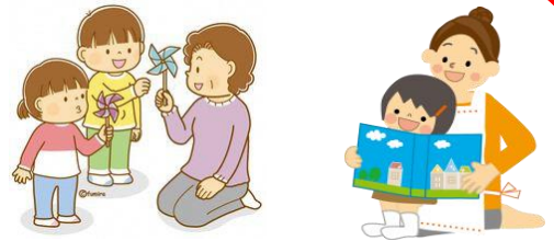
保護者の外出時の一時預かり