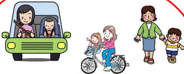
保育所（園）・幼稚園・小学校・習い事 等の送迎

市内在住で心身ともに健康な成人の方ならどなたでも登録できます。 興味のある方は、ぜひお問い合わせください。 謝礼は30分当たり350円です。